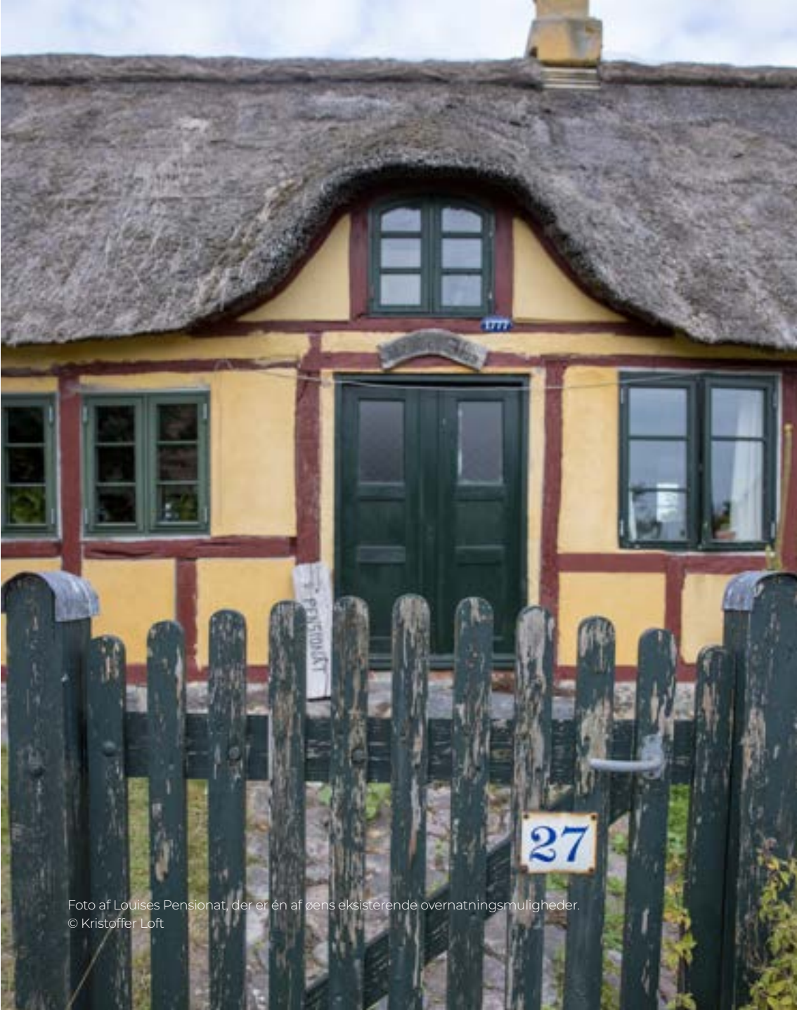
Foto af Louises Pensionat, der er én af zens eksisterende overnatningsmuligheder.