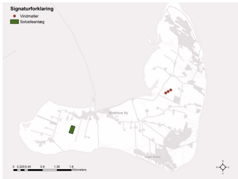
Figur 8.19. Kortet viser et udpeget areal på 30.000 kvadratmeter til et solcelleanlæg, samt placeringen af tre vindmøller. Dermed viser kortet scenarie 3 samlet set.

Det er vigtigt at notere sig, Endelaves energiforsyning er sårbar, da øen er helt afhængig af et intakt søkabel. Ved strømafbrydelser fungerer kommunens beredskabsplan i dag fint, da en mobil transformator, der sejles over, kan forsyne øen imens reparationer sker.