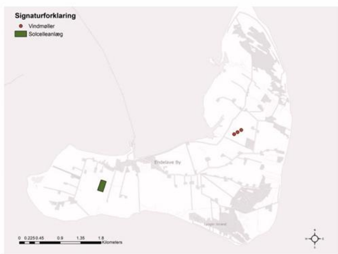
Figur 8.19. Kortet viser et udpeget areal på 30.000 kvadratmeter til et solcelleanlæg, samt placeringen af tre vindmøller. Dermed viser kortet scenarie 3 samlet set.

Endelave Beboerforening er af den opfattelse, at solenergi-anlæg på de naturfattige landbrugsarealer ikke nødvendigvis strider mod ovennævnte beskyttelseshensyn - afhængigt af placeringen. Arealerne kan nemt omkranses med hensigtsmæssig beplantning og vil med en ny planlov være mulige. Beboerforening har i 2023 haft Ålborg Universitet til at udarbejde et forslag til VE anlæg på øen: "Endelaves Energisystem - Tre Fremtidsscenerier" /Ref.18/. Det ses, at der kan udpeges begrænsede arealer, der ikke konflikter med ovennævnte beskyttelseshensyn. For solenergianlæg er det arealer på vestøen, som vil kunne dække store dele af øens strømforbrug.