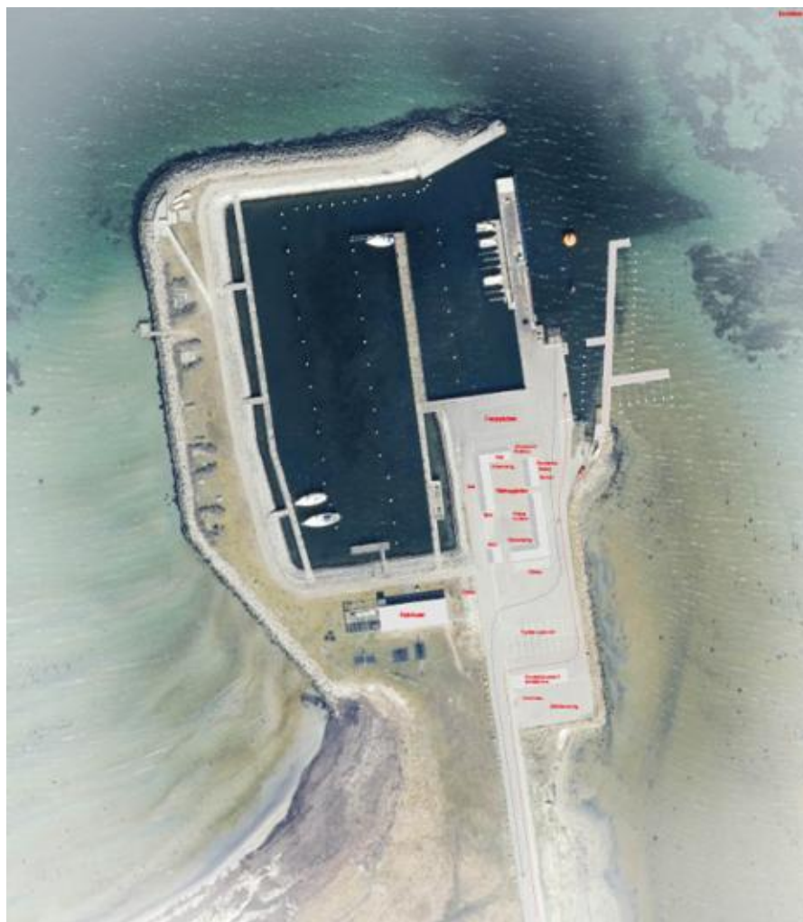
Skitse over fremtidig disponering af havnearealet og fremtidig bebyggelse

Skitsen viser fremtidig disponering af havnearealet og fremtidig bebyggelse. Skitsen blev udarbejdet på baggrund af to borgermøder på Endelave /ref. 2/, da øboerne ikke fandt, at SFU-planens disponering opfyldte øens behov.